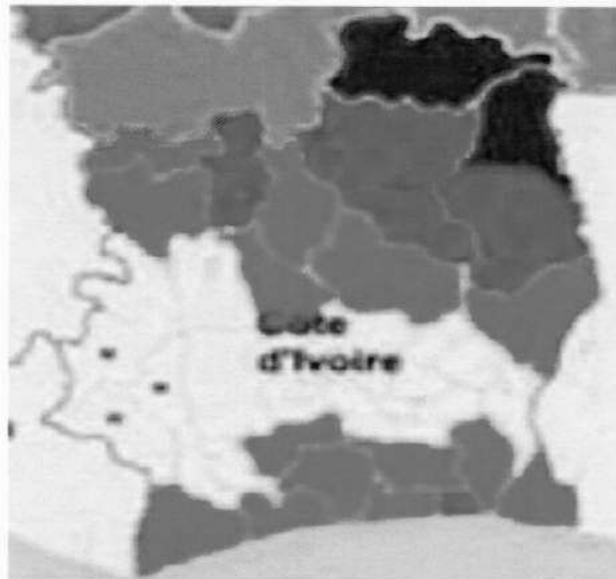
Figure 1 Zones climatiques Côte d'Ivoire